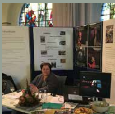
Eerste zorgbeurs Zoersel