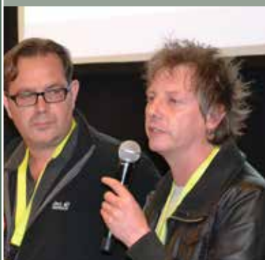
HOP aanloophuis wint Hospitality Award op Health & Care in Flanders Expo Gent