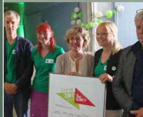
StigWA studiedag 'Groetjes vanuit de psychiatrie'