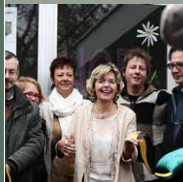
Opening aanloophuis HOP