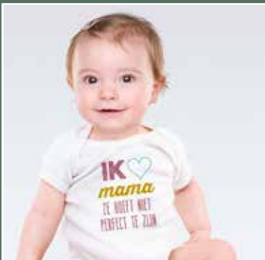
september Pilotproject perinatale geestelijke gezondheidszorg van start