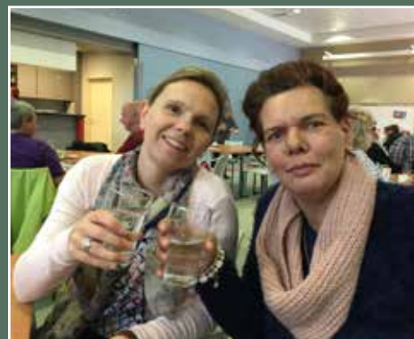
mei Eerste grote gezondheidsweek PC Bethanië