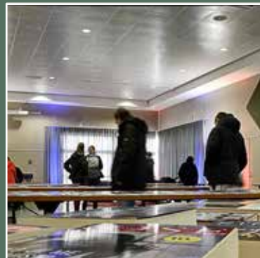
november Boekenbeurs op het domein