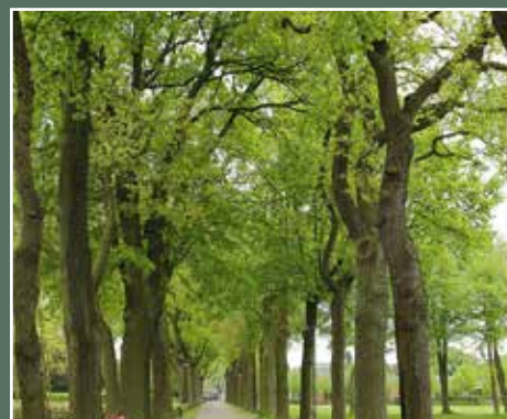
juli Bomen-in-zicht bomenwandeling op het domein