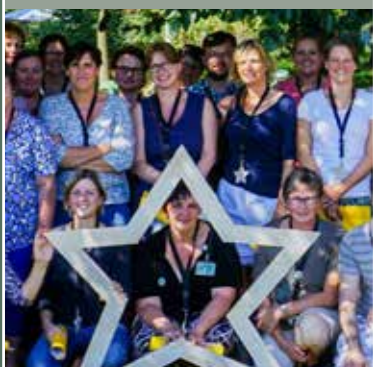
Eerste sterrendag voor medewerkers met een veelvoud van zeven dienstjaren