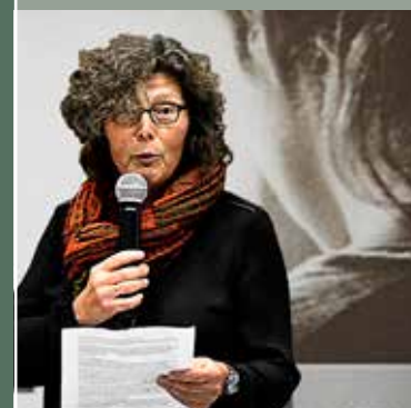
Filmvertoning Moeder-Baby-Eenheid 'Das Fremde in mir' en voorstelling nieuwe website