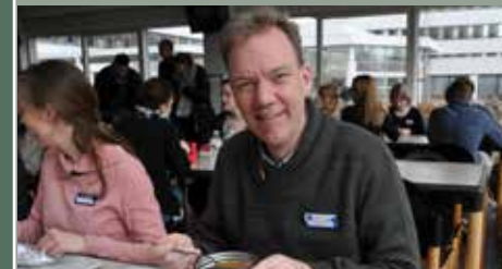
Solidariteitsmaaltijd t.v.v. Broederlijk Delen