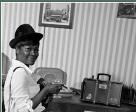
Januari Nieuwjaarsfeest 2016