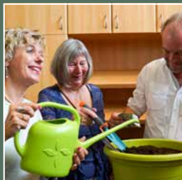
Opening sociale kruidenier De NetZak en nieuwe locatie voor De Facktorij