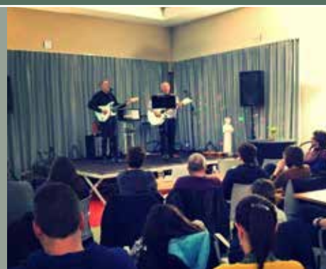
Tussen licht en duisternis: patiënten Rif geven een concert t.v.v. stigWA