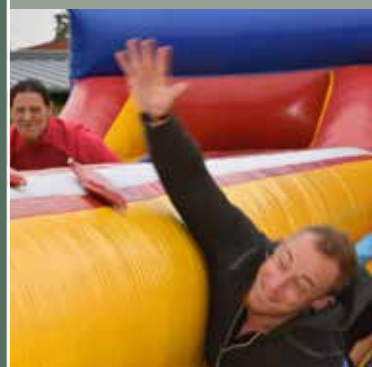
Vrijwilligers Janssen Pharmaceutica organiseren Bethaniëfestival