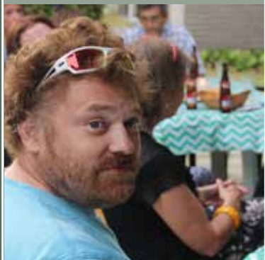
Buurtfeest Beschut Wonen De Sprong