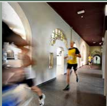
Inside-Out-Run lokt 200 lopers