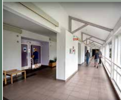
Zorginspectie bezoekt PZ Bethaniën- huis