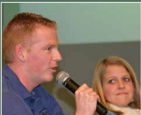
april Symposium 20 jaar IBE 'Jammen naar afgestemde zorg'