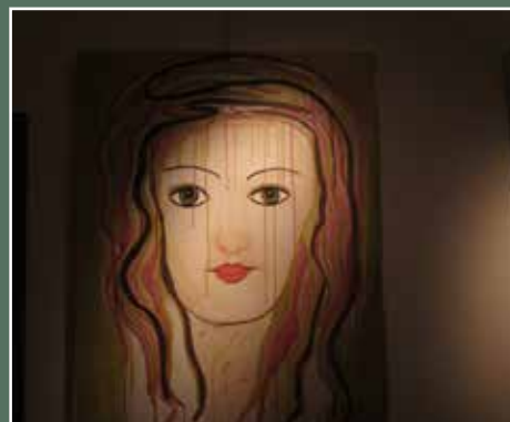
juni Tentoonstelling De Facktorij in Oude Pastorij Malle