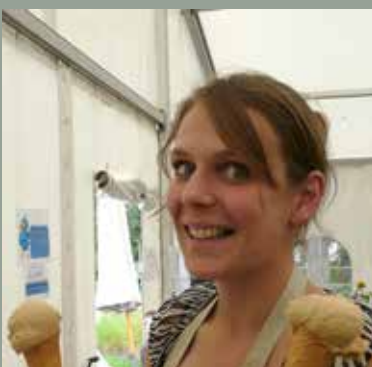
Groot Landhuizenfeest PVT De Landhuizen