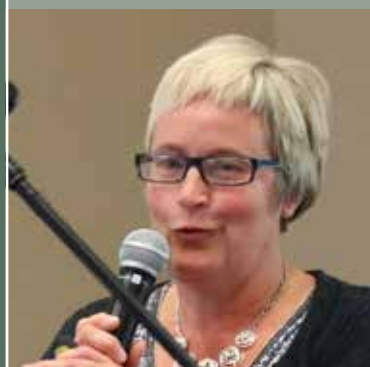
Studiedag KOPP 'De taal van de intuïtie'