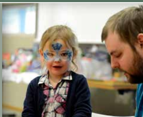
100ste gezinsactiviteit KOPP