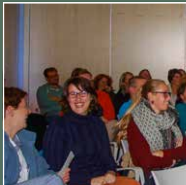
oktober Kwaliteitsdag 'Hoe laad ik mijn batterijen op?'