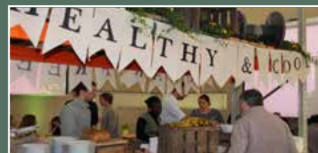
maart Lentebrunch voor alle medewerkers