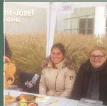
Beschut Wonen De Sprong verzamelt geld in voor TEJO en Music for Life